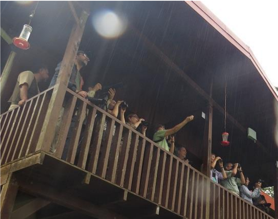
Fotografía 8: La única foto del grupo que pude obtener, estaban muy distraídos y no los culpo