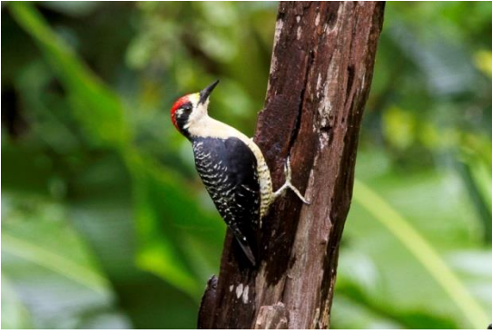
Fotografía 7: Melanerpes pucherani por Eduardo Mena