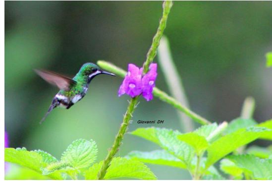
Fotografía 4: Hembra de Discosura conversii por Giovanni Delgado