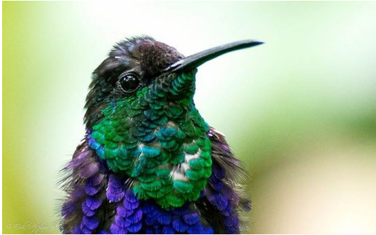
Fotografía 1: Macho de Thalurania colombica por Erik Alpízar