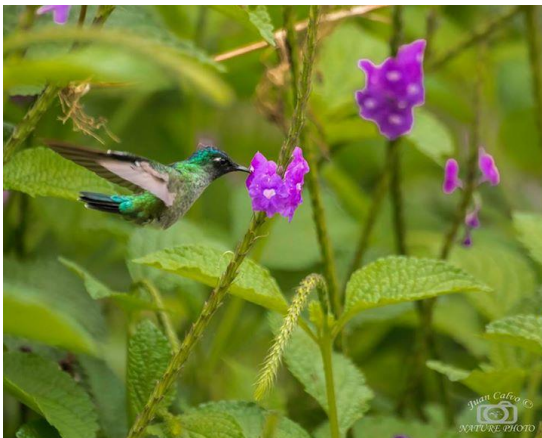
Fotografía 3: Klais guimeti alimentándose, por Juan Carlos Calvo