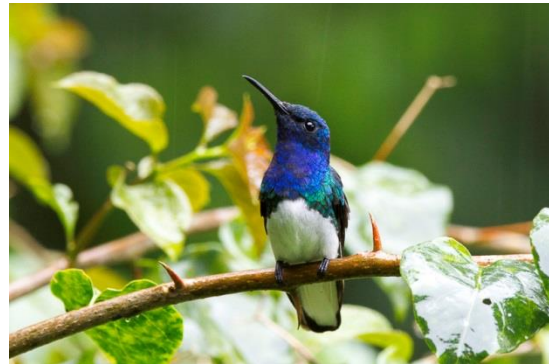
Fotografía 5: Macho de Florisuga mellivora