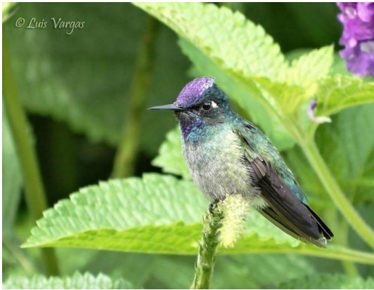
Fotografía 2: Klais guimeti por Luis Vargas