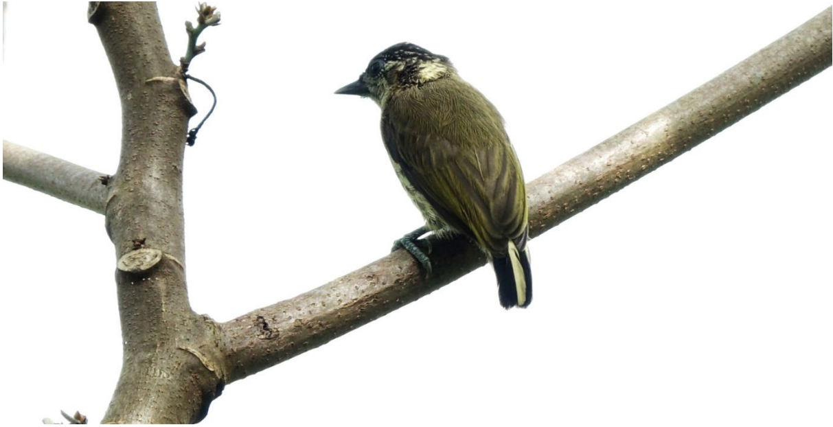
Picumnus olivaceus