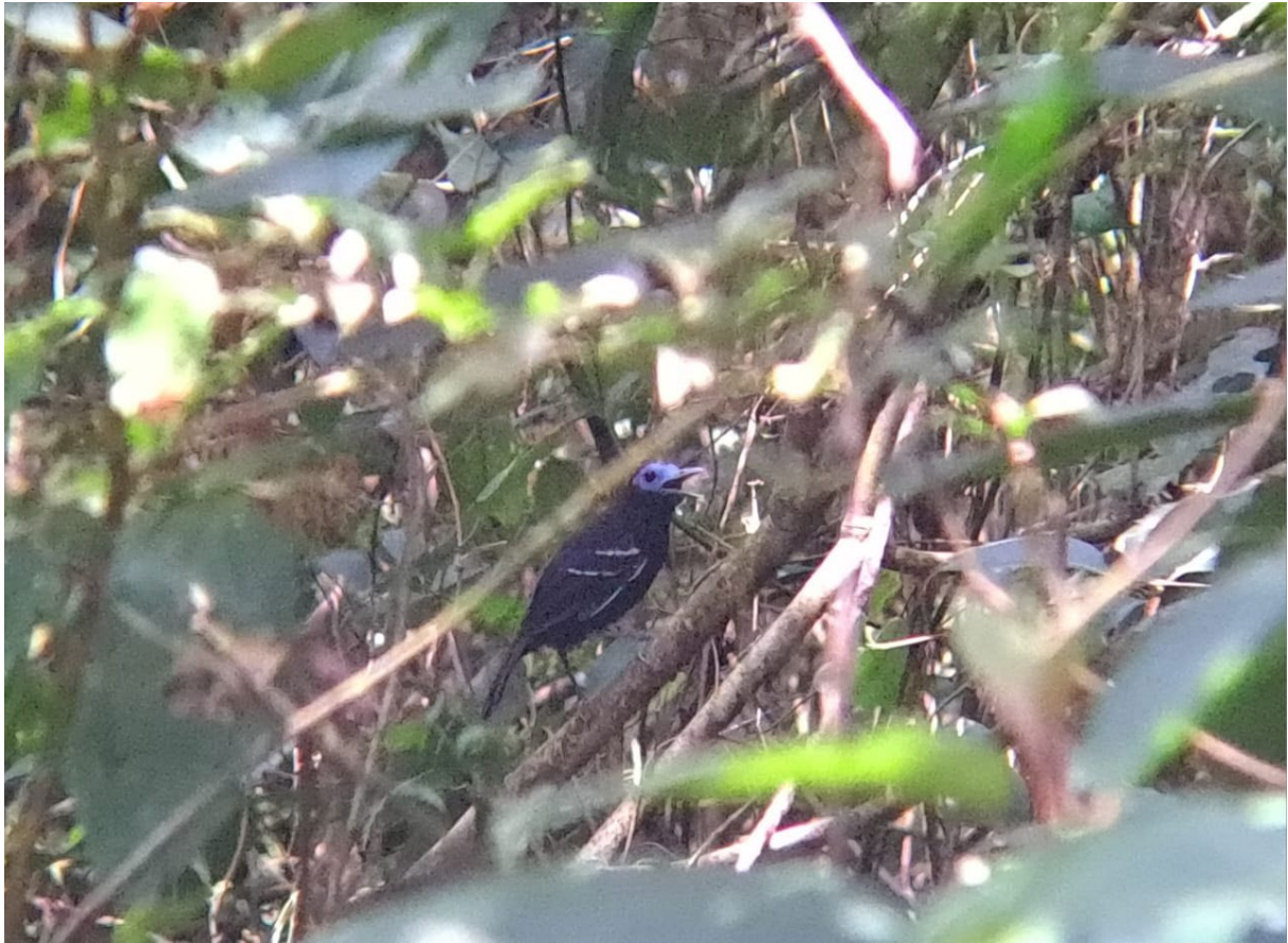
Gymnocichla nudiceps