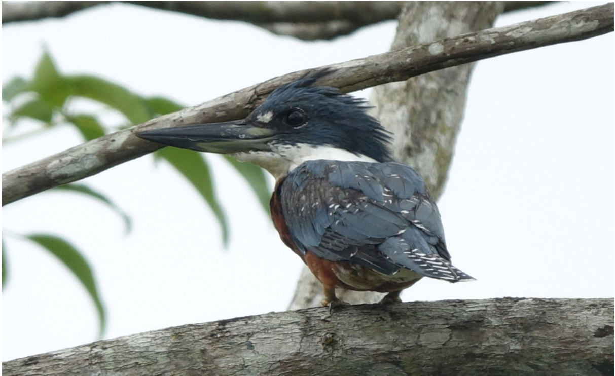
Megaceryle torquata