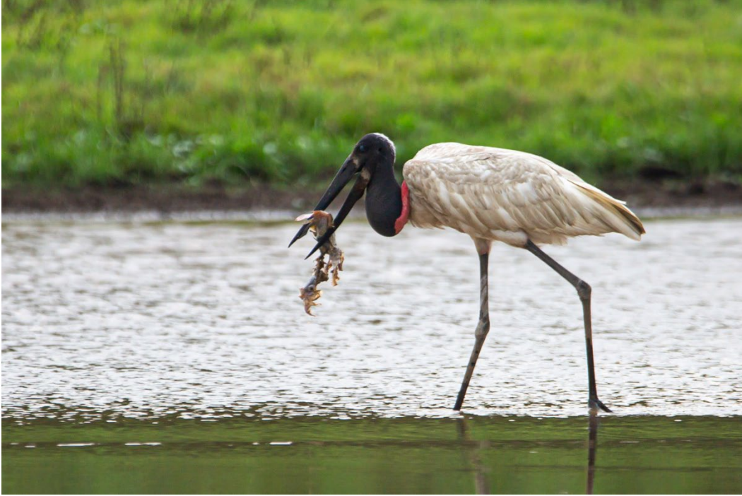
Jabiru mycteria