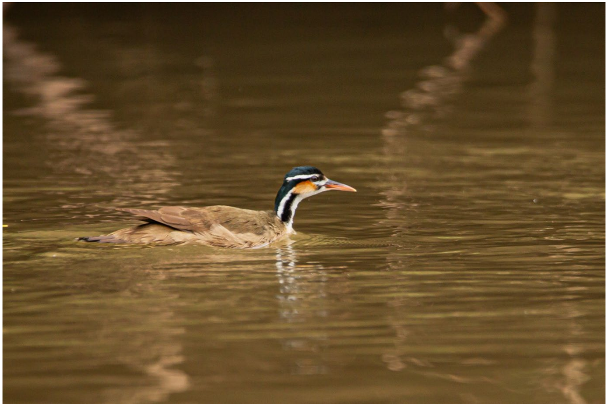
Heliornis fulica