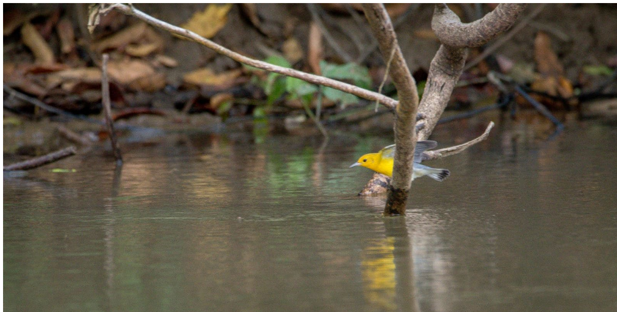
Protonotaria citrea