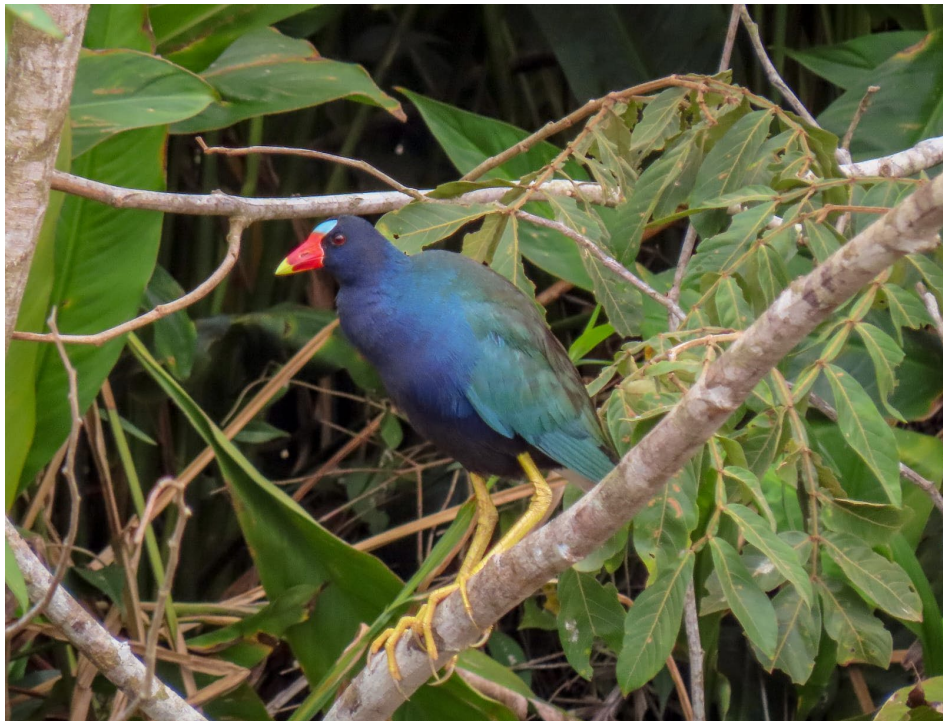
Porphyrio martinicus