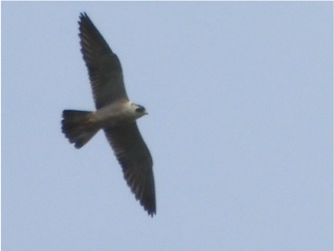
Falco peregrinus