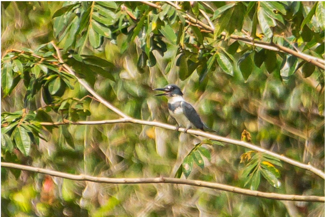
Megascops alcyon